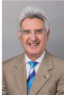
2025-26年度 フランчесスコ・アレツツォRI会長