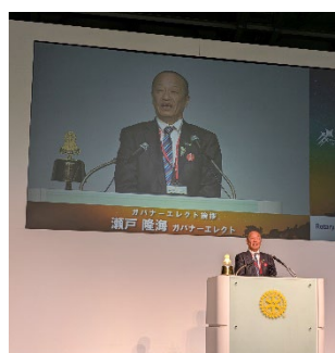
瀬戸ガバナーエレクト挨拶