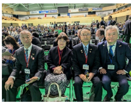
地区役員は最前列の席