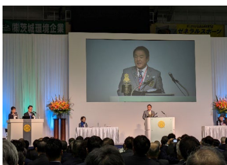
大高ガバナー挨拶