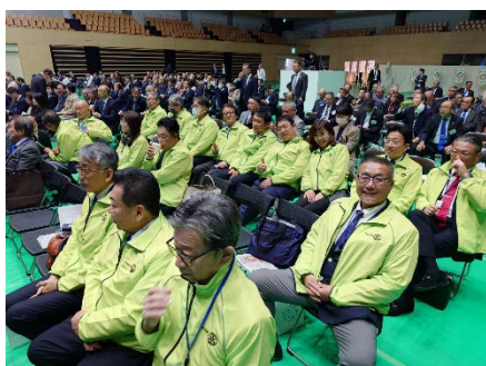
午前11時30分頃 お揃いのウェアをまとい息高揚！前半のクライマックス→次ページ