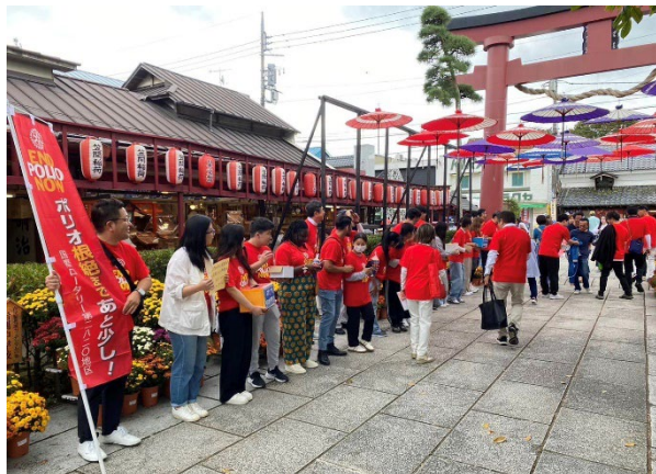
鳥居付近での募金活動です。募金したのですが次の列の人たちから再度声を掛けられ「あっちで入れました」と。