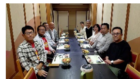
ウォークラリー出発前、米山奨学生も参加。さあがんばるぞ〜。 ↑