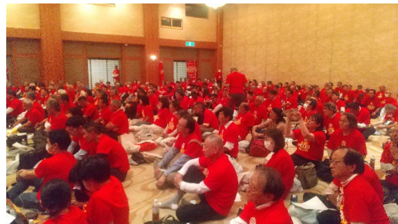
ともかくにも会場は赤一色で熱気ムンムン。暑い！空調無しでしたので幾分酸欠気味。