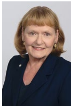
2024-25年度 ステファニー A. アーチック RI会長