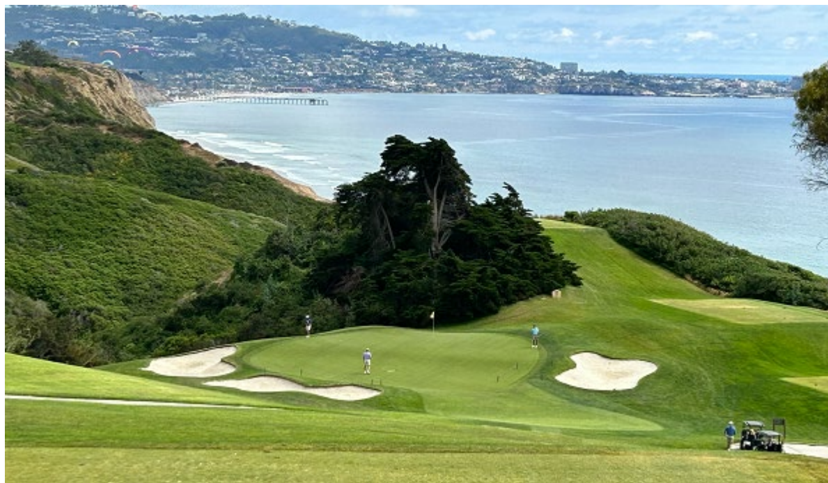
サンディエゴのトーリーパインズゴルフコース