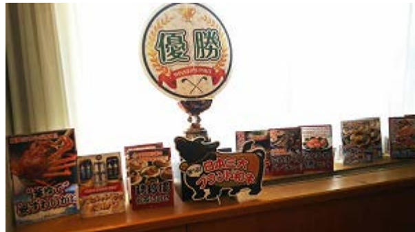
親睦活動委員会の皆様