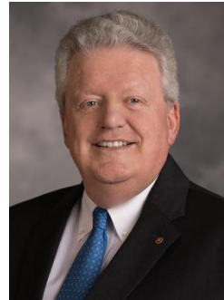
2019-2020 年度 RI 会長 マーク・マローニー