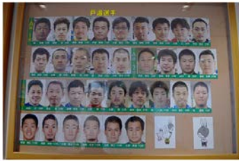
取手競輪茨城支部所属選手