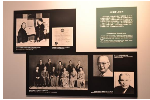
多くの遺品やロータリーの歴史も見学できました。