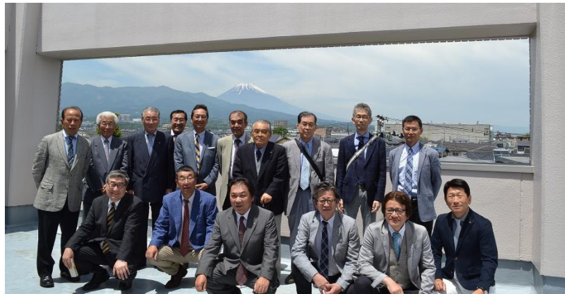
記念館屋上にて富士山をバックに撮影。松村会員トイレでした。(笑)