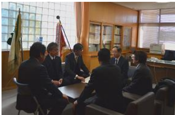
水海道二高 校長室にて