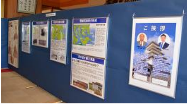
ご覧のようなパネルです