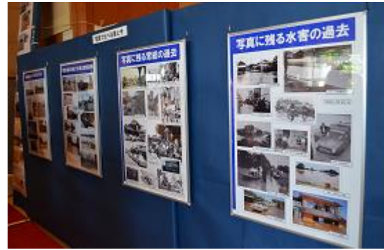
石下のお城ホール