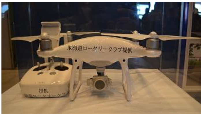
水海道RC提供のドローンも展示されています