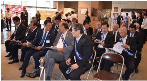
除幕式オープニング前