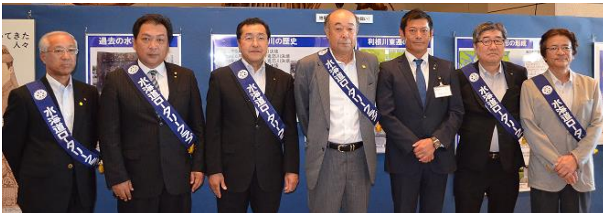
ロータリーメンバー・神達市長と記念撮影