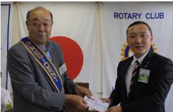
がんばっぺ常総に協賛金