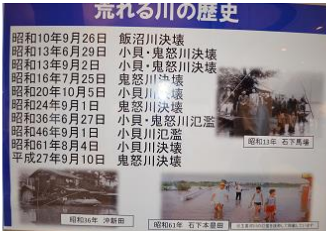
どうぞ足をお運びください