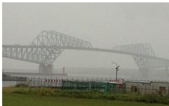
「雨に煙る東京ゲートブリッジ」