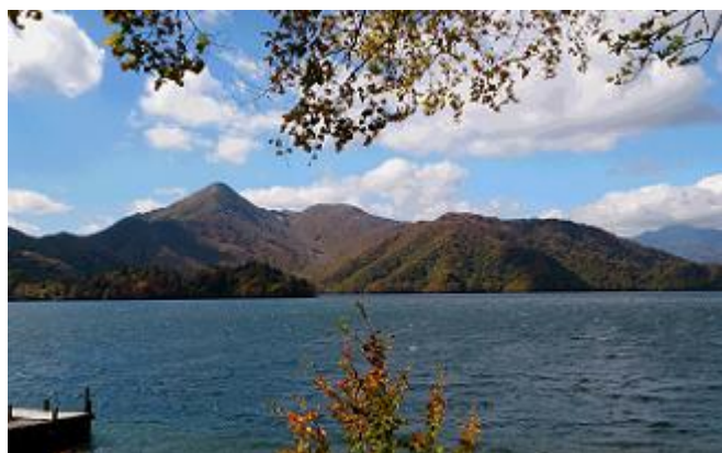
「中禅寺湖の紅葉」

点 鐘 ロータリーソング ビジター紹介 出席報告 S A A 報告 諸 報 告 幹 事 報 告 会 長 挨 拶 外 部 卓 話 飯田 勉様