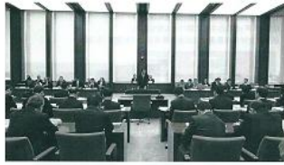
神達 岳志 1969年3月18日生まれ(44歳)