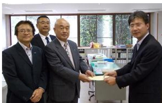
つくばみらい市社会福祉協議会へ