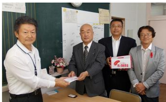
常総市社会福祉協議会へ

また、バザー協力のお願いをFAXさせていただきました。ご協力頂けます方は、来週の例会までにお問い合わせ申し上げます。