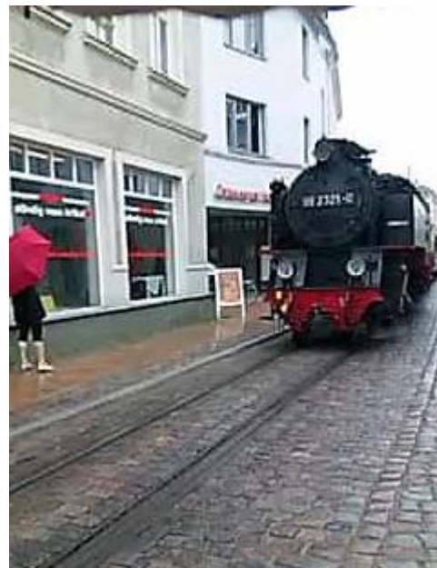
「バートドーベランを行くSL」

点 鐘 君が代・ロータリーソング ビジター紹介 出席報告 SAA報告 諸報告 幹事報告 会長挨拶 会長・幹事会報告 他