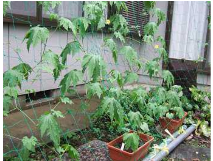
「グリーンカーテン(ゴーヤ)」