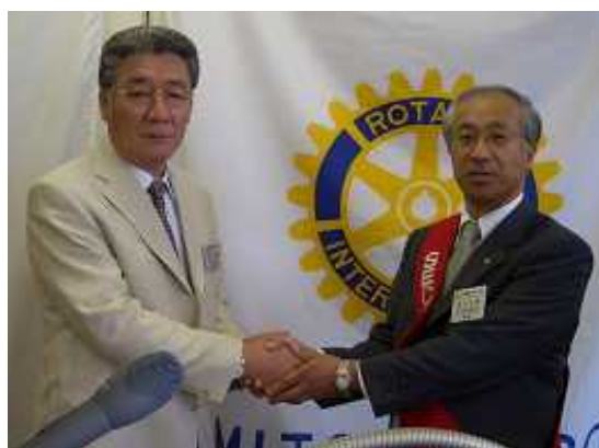
田上前幹事より染谷幹事へ