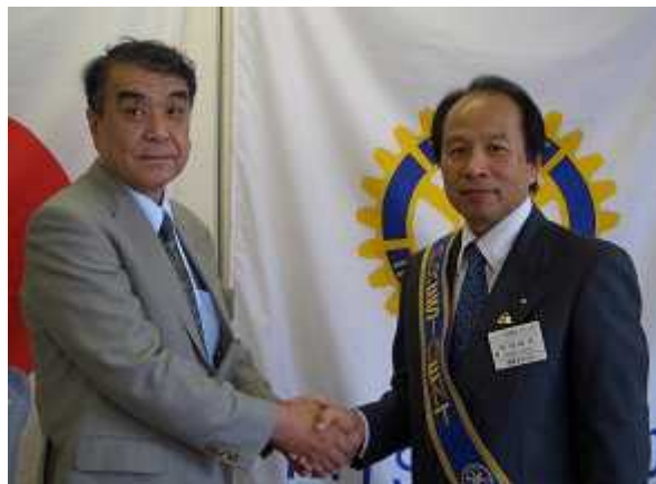
大串前会長より秋田会長へ