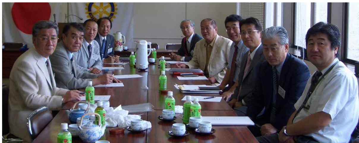
2008 - 09年度 理事・役員