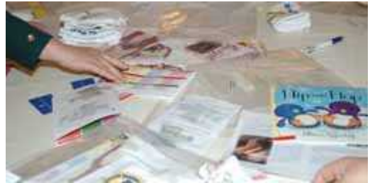
幼児用読み書きセットを贈る

オーストラリアの原住民であるアボリジニの人たちに英語を教えるため、同国のリチャード・ウォーカー博士がCLE (Concerned Language Encounter)という言語教育法を開発しました。ウォーカー博士はロータリアン(ロータリークラブの会員)です。CLEというのは、例えば、子どもたちなら画用紙からお面をつくったり、人形をつくったりという簡単な工作をしながら文字を教えていきます。成人の女性なら、料理や裁縫、手工芸といった実用的な、そして収入にも結びつくようなものを取り上げて、そういった作業をしながら文字を学んでいきます。