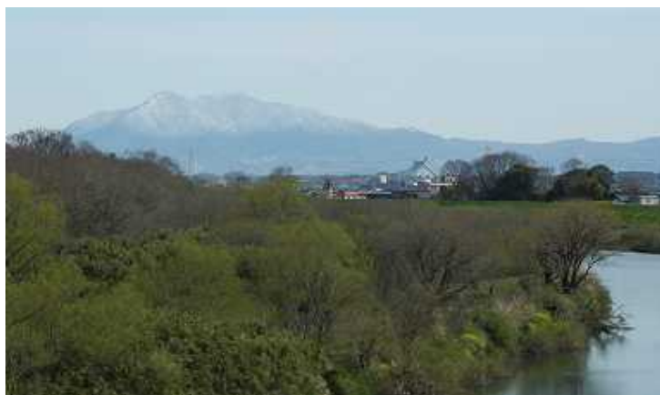
4月2日の筑波山雪景色 水海道有料橋より撮影