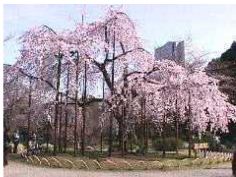
枝垂桜 (しだれざくら)