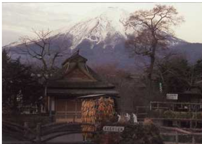
忍野八海にて撮影