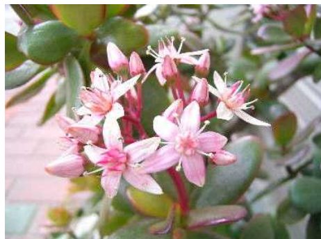
金の成る木 (かねのなるき)