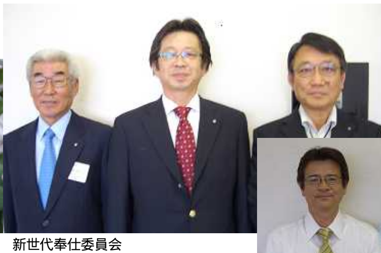
新世代奉仕委員会