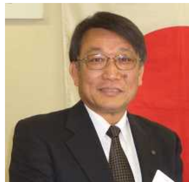
表 彰 スポンサーピン(会員増強)