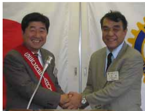
大串前幹事より熊谷幹事へ