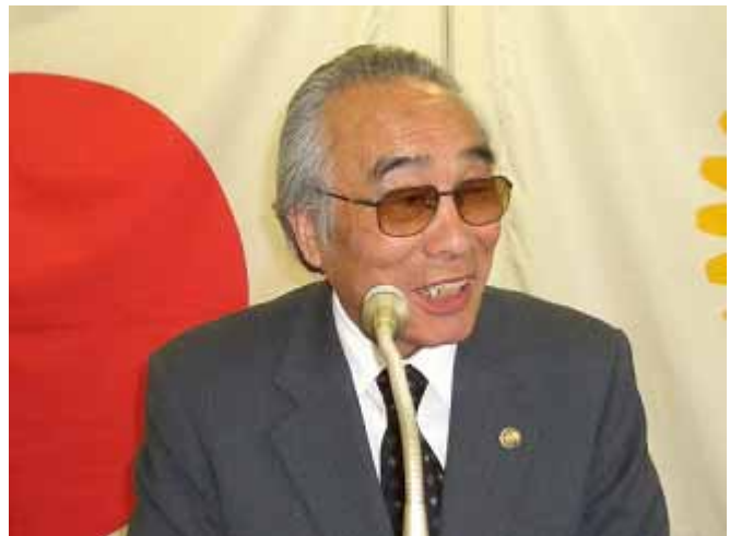
遠藤 利常 総市長