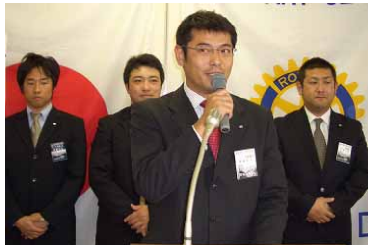
(社)水海道青年会議所の皆様